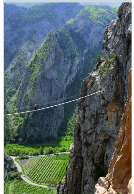
Via ferrata de la Grande Fistoire

« Un territoire central entre Provence et Dauphiné »