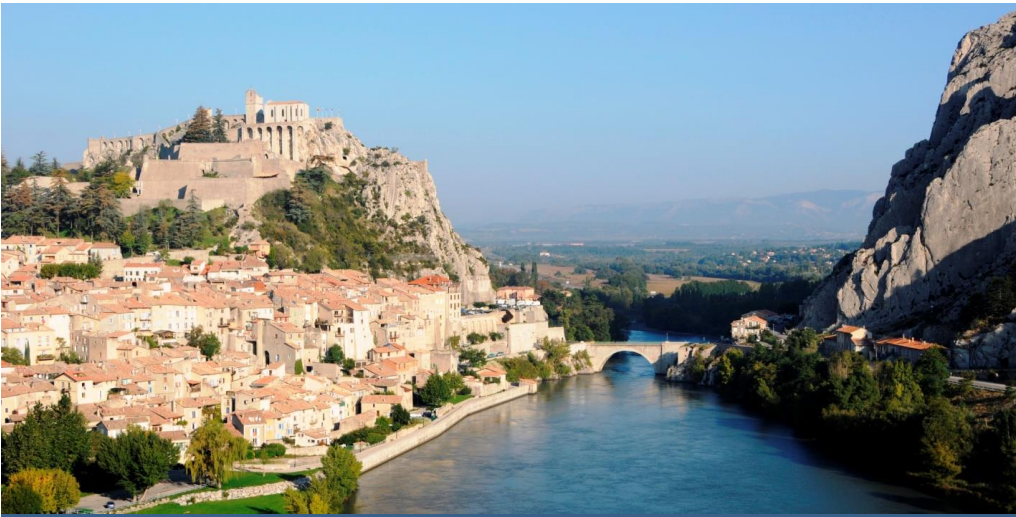
Panoramique sur la citadelle, la Durance, la Baume