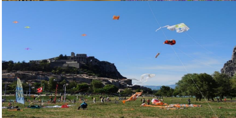
Crédits : Marc Linarès – chamois / SI Vallée du Jabron – champ de lavande OT Sisteron – fête du vent